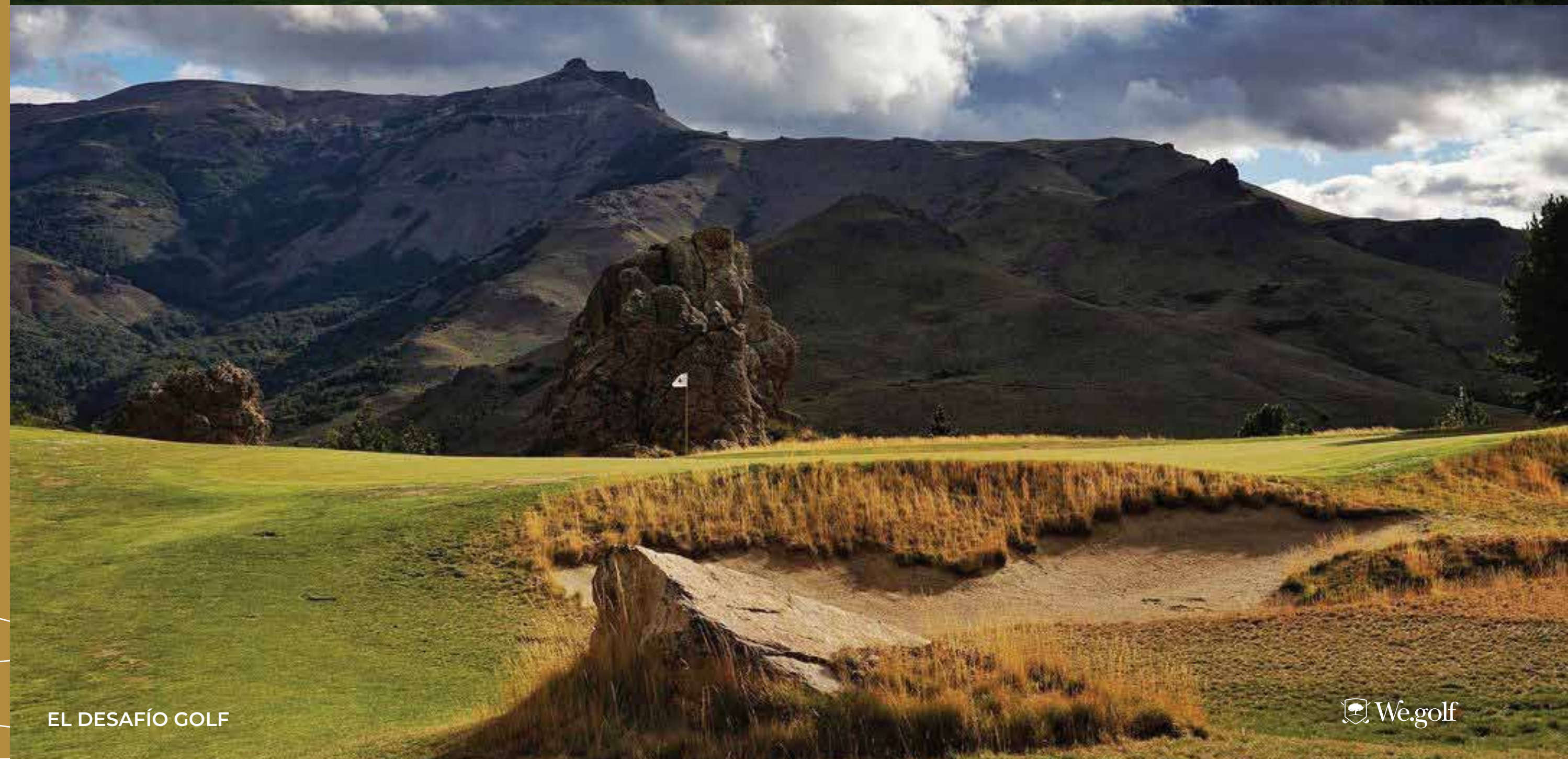
EL DESAFÍO GOLF