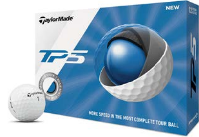
1 docena de pelotas

Welcome Kit Exclusivo estampado con el logo de tu elección