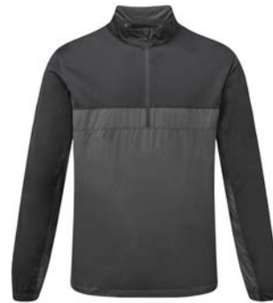
1 campera rompevientos