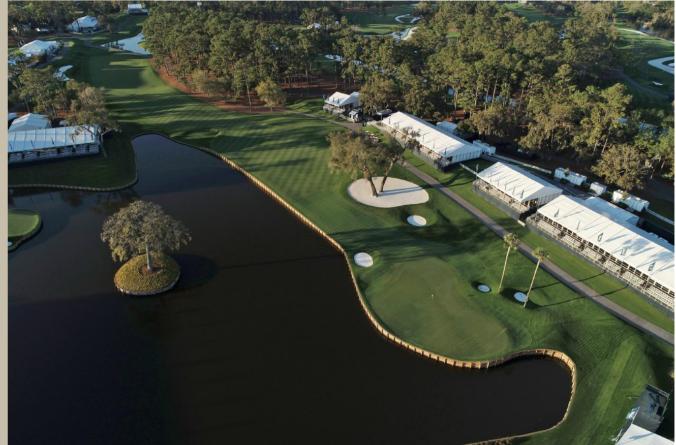
TPC Sawgrass / Hoyo 16